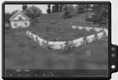
Westen kontrolliert die Flagge im Dorf.

Dieser Einsatz ist eine Schlacht, Trupp gegen Trupp, um die Kontrolle des Gebiets. Jeder Trupp besteht aus sechs Soldaten. Der Erfolg hängt von der Kontrolle über fünf getrennte Orte ab. Zwei befinden sich in der Nähe des Startpunkts jeder Seite und der fünfte in der Mitte. Die Kontrolle über die mittlere Flagge ist wichtig, da sie zwei Punkte pro Minute einbringt. Daher kannst du das Spiel zu einem Unentschieden bringen, wenn du diese und eine der anderen Flaggen besitzt. Der andere Spieler muss drei Positionen schützen, während du nur zwei bewachst. Dadurch erlangst du größere Flexibilität beim Starten eines Angriffs zur Eroberung einer dritten Flagge.