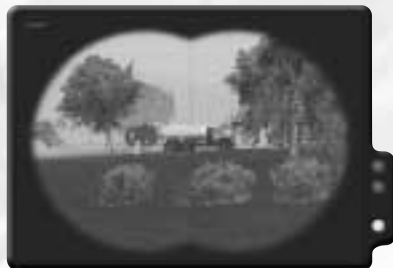
Mache so viele Wachen wie möglich ausfindig.

Du nimmst an einem Einsatz mit den Guerillas teil, um Zivilisten zu befreien, die von den sowjetischen Truppen als Geisel genommen wurden. Zu Beginn überblickst du ein Dorf. Deine erste Aufgabe ist es, so viele der wachhabenden Truppen wie möglich ausfindig zu machen. Nimm dein Fernglas zur Hand und suche damit das Dorf ab. Rechtsklicke bei jedem gegnerischen Soldaten, den du genau im Visier hast, um diese Information an die Guerillas weiterzugeben. Wenn alle gefunden wurden, wechsele wieder zu deiner M16 und warte, bis die Action beginnt.