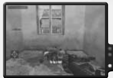
Dieser Soldat ist nicht weit mit der Flagge gekommen.

Dieser Einsatz für bis zu acht Spieler ist ein Deathmatch mit einem spaßeshalber eingestreuten "Eroberer die Flagge"-Element. Jeder ist dein Feind. Du bekommst 1 Punkt für jeden Gegner, den du tötest, und 10 Punkte, wenn du die Flagge ins Dorf bringst. Was die Sache noch schwieriger macht, ist, dass du dich in einem abgegrenzten Gebiet befindest. Wenn du die Grenzen verlässt, wirst du getötet. Falls du stirbst, wirst du irgendwo um die Flagge herum wiederbelebt.