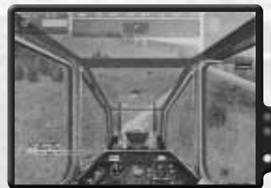
Panzer sind für deine Raketen leichte Beute.

Sobald der Konvoi ausgelöscht ist, folge deinem Anführer nach Le Moule und den feindlichen Panzern. Mache ein TOW bereit und halte nach dem Shilka Ausschau. Dies ist quasi der einzige Gegner, der dich während dieses Einsatzes vom Himmel holen kann. Deswegen solltest du ihn zuerst anvisieren und zerstören. Benutze deine TOW-Raketen, um die T72s und T80s zu zerstören. Bei einigen werden mehrere Treffer nötig sein. Wechsle dann zu FFARs für andere Ziele.