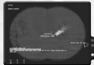
Da ist der erste Shilka.

Lass deinen Trupp am Anfang des Einsatzes nach Nordosten zu Dd75 marschieren. Dort kommt ein BMP in eure Richtung, um eurer Landung nachzugehen, also mach dich aus dem Staub. Setze deinen Weg nach De74 fort und mache dort Halt. Suche den Horizont mit deinem Fernglas ab, um irgendwelche Gegner im Umkreis aufzuspüren.