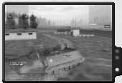
Fahre mit dem M113 zum sowjetischen Lager, um einen Hind zu stehlen.

Dieser Einsatz ist hart, weil du schnell vorgehen musst, um deine Einsatzziele zu erfüllen. Rüste dich mit einem LAW-Werfer und drei Raketen aus, bevor du den Einsatz beginnst. Ersetze die Sprengladungen der Black Ops durch Minen.