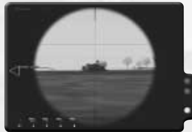
Rufe Luftunterstützung, sobald der Shilka zerstört ist.

Falls er jedoch scheitert, befiehl nur einem LAW-Soldaten, auf die Panzerfahrzeuge zu zielen. Du musst dir die Raketen für später aufheben. Nachdem du den Gegenangriff vereitelt hast, wechsle zur Keilformation und mach dich auf den Weg nach Westen zu Dg04. Wende dich dann nach Süden und laufe zum Flugplatz. Halte deinen Trupp zurück, während du voraus kriechst, um den Shilka ausfindig zu machen. Befiehl dann den LAW-Soldaten, zu dir aufzuschließen und den Shilka zu beseitigen. Falls sie beide getötet werden, musst du einen LAW aufheben und es selbst erledigen. Wenn er aus dem Weg ist, ziehe dich zurück und rufe die Cobras herbei, indem du [0], [0], [2] drückst.