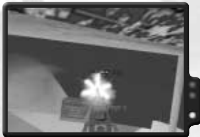
Zerstöre die sowjetischen Schiffe, die sich deiner Position nähern.

Du kannst sogar versuchen, den Sprengsatz des Ersten an dich zu nehmen, ihn entlang des Weges, den er kam, zu platzieren, und ihn detonieren zu lassen, wenn der Zweite sich nähert. Sobald beide Speznaz tot sind, laufe nach Süden den Hügel hinauf und am Leuchtturm vorbei zum M2 Geschütz. Übernimm die Kontrolle darüber und feure auf ein paar feindliche Schiffe, die sich aus südwestlicher Richtung nähern. Du kannst sie versenken, wenn du oft genug triffst. Schließlich taucht ein feindlicher Hubschrauber auf. Versuche ihn abzuschießen. Egal, ob du die Schiffe oder den Hubschrauber erwischst, dein Beschuss wird sie fortjagen und dein Einsatz ist beendet.