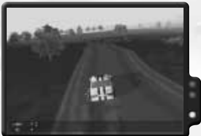
Es macht höllischen Spaß, mit dem Sportauto zu fahren.

Du beginnst in einer Cessna, mit der du nach Everon fliegst. Lande am Flughafen. Falls du bei der Landung Probleme hast, benutze dafür den Autopilot im Aktionsmenü. Am Boden angekommen, bemerkst du ein davonfahrendes Sportauto. Wenn du zum Offizier am Tisch hinüber gehst, erzählt er, dass er zwar keine weiteren Autos hat, du aber mal mit den Piloten beim Blackhawk sprechen kannst. Wenn du das tust, berichten sie dir, dass sie in ein paar Minuten nach Morton aufbrechen. Du kannst mit ihnen fliegen. Warte einfach, bis sie an Bord gehen, und hüpfе dann selbst hinein. In Morton kannst du einen kleinen weißen Trabi finden, mit dem du nach Lamentin fahren kannst, um Robert abzuholen. Danach kannst du den Trabant gegen ein Sportauto eintauschen und die anderen beiden abholen.