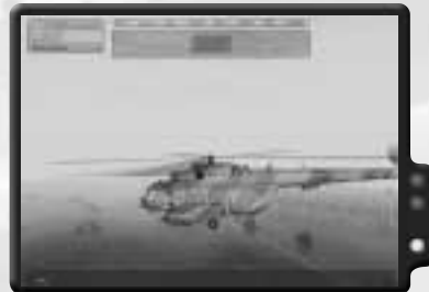
Der Mi17 ist das schnellste Transportmittel für diesen Einsatz.

Die Fahrt um Everon kann eine Weile dauern. Tatsächlich kannst du bei diesem Einsatz mal sehen, wie groß diese Gebiete eigentlich sind. Deswegen solltest du fliegen anstatt zu fahren. Am Flughafen steht ein Mi17 Hubschrauber, mit dem du ohne Pilot und Schützen, wie im Blackhawk, fliegen kannst. Der Mi17 hat nur noch wenig Treibstoff, also fahre den Treibstofflastwagen neben den Hubschrauber und setze dich auf den Pilotensitz des Mi17. Benutze das Aktionsmenü, um aufzutanken, und fliege dann los nach Lamentin.