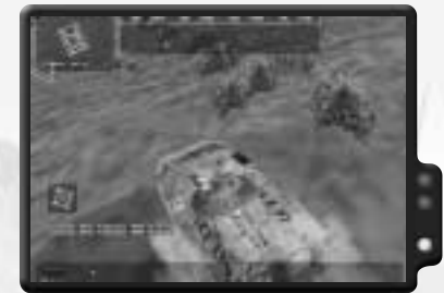
Der BMP kann das Schlachtfeld dominieren, wenn er richtig eingesetzt wird.

Der Osten besitzt mit dem BMP mehr Feuerkraft; ihre Flagge wird jedoch nicht von einem Bunker verteidigt. Dein Ziel ist es, die LAW-Soldaten des Westens zu erledigen. Sobald sie Geschichte sind, kannst du losstürmen, um die US-Flagge mit deinem BMP zu holen. Er kann die M113 des Westens beseitigen, ohne Beschädigungen zu riskieren. Tatsächlich kannst du deine Flagge unverteidigt zurücklassen und dich auf die Offensive konzentrieren.