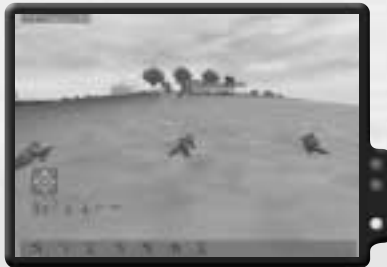
Trupp Alpha nimmt den Hügel ein.

Du musst für diesen Einsatz eine Menge tun. Zum Glück bekommst du sowohl von zwei Trupps als auch von Jagdhubschraubern Unterstützung. Beginne damit, deinen Trupp in Linienformation zu bringen und den Hügel hinaufzustürmen. Du solltest ihn ohne Mühe einnehmen können.