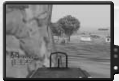
Mähe so viele Gegner wie möglich nieder.

Sobald das Geschütz in deiner Hand ist, solltest du in die Waffenperspektive wechseln, um deine Ziele besser erkennen zu können. Dufeuerst auf die rechte Flanke der Sowjets, so dass die gegnerischen Truppen von der linken Seite zur rechten laufen. Achte darauf, unverzüglich auf jeden Soldaten zu zielen, der auf dich schießt.