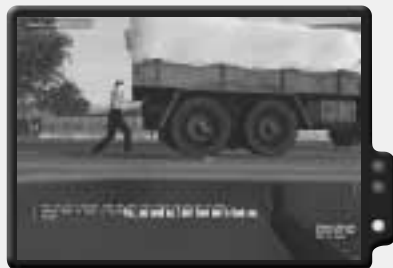
Schaffe die Geiseln sicher auf den Lastwagen.

Die Black Bear force werden den Schalter ausschalten. Sobald das passiert, solltest du damit beginnen, auf die sowjetischen Truppen im Dorf zu schießen. Du musst sie schnell erledigen, bevor sie die Geiseln verletzen können.