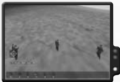
Nehmt den Hügel ein!

Nachdem er zerstört ist, könnt ihr einige Cobras zur Unterstützung rufen, die sich um die Panzer rund um den Flugplatz kümmern. Wenn die Luft rein ist, dringt ein und erledigt die restlichen Fußtruppen.