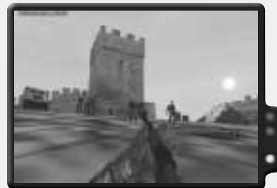
Die Burg ist das Hauptquartier des Widerstands.

Spring auf Befehl hinaus und erledige den Offizier und die anderen Soldaten, die sich dort aufhalten. Nimm den toten Gegnern, falls nötig, etwas Munition und Granaten ab und laufe nach Süden die Straße hinunter. Ein weiterer Lastwagen voller Soldaten kommt dir von Süden entgegen. Gehe hinter einem Gebäude in Deckung, vergewissere dich, dass du ein volles Magazin in deinem Gewehr hast, und mache dich bereit. Erledige die Soldaten, sobald sie aussteigen. Wenn die Luft rein ist, laufe zusammen mit dem Rest der Guerillas nach Osten auf den Wald zu. Unterwegs wirst du auf einige sowjetische Soldaten stoßen. Erledige sie und laufe weiter. Oben angekommen, wende dich nach Süden in Richtung der Burg. Du kannst deinem Anführer folgen, oder, falls alle Guerillas ausgeschaltet wurden, alleine weiterlaufen. Bist du an der Burg angekommen, laufe die Rampe hinauf und zur Spitze des Turms, um mit dem Anführer des Widerstands zu reden und den Einsatz abzuschließen.