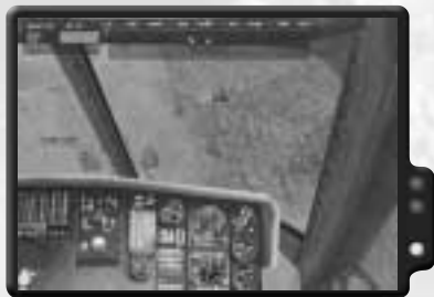
Zerstöre den BMP.

Sobald du auf dem Boden bist, wird die Infanterie automatisch an Bord gehen. Wenn alle drinnen sind, hebe ab und befördere sie nach Montignac. Lande dort und sie werden aussteigen. Während du zum Stützpunkt zurückfliegst, erhältst du neue Befehle: Evakuere einen Trupp mit Verwundeten. Ändere den Kurs und sammle sie ein. Zerstöre auf dem Rückweg einige BMPs mit deinen FFARs. Visiere die BMPs mit einem Rechtsklick an, gib deinem Schützen dann mit einem Linksklick den Befehl zum Feuern. Er wird warten, bis der kleine weiße Punkt über dem Ziel erscheint. Dies zeigt an, wo die Rakete einschlagen wird. Du kannst auch zum manuellen Feuern wechseln und versuchen, selbst welche abzuschießen. Nachdem du die BMPs beseitigt oder du keine Lust mehr hast, es weiter zu versuchen, kehre zum Flugplatz zurück, um den Einsatz abzuschließen.