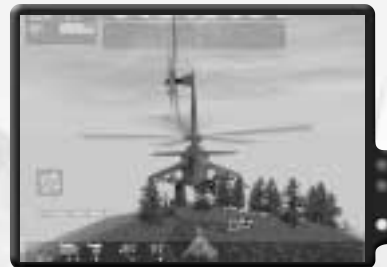
Die SCUD ist in Sicht.

Wenn du zu Guba gelangst, wird er offenbaren, dass eine zweite SCUD in Kürze abgefeuert werden soll. Du hast keine Zeit zu verlieren. Guba verhält sich nun als Teil deines Trupps, also befehl ihm, den Hind zu besteigen, während du dich auf den Pilotensitz schwingst. Sind alle an Bord, kannst du abheben und nach Osten zu Hd40 fliegen. Du musst bis auf 150 Fuß aufsteigen, damit du keine Hügel rammst. Fliege schnell, um die Gefahr zu verringern, von feindlichem Bodenfeuer getroffen zu werden. Halte dich nicht unnötig damit auf, den Feind am Boden anzugreifen. Du musst die SCUD schnellstens erreichen. Wende dich nach Nordwesten und bleibe über dem Wasser, während du nach Ih25 weiterfliegst. Senke deine Höhe über dem Wasser auf unter 25 Fuß. Wende dich bei Ih25 wieder nach links und fliege nach Norden zu Ih20.