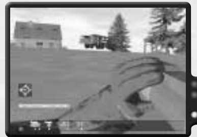
Falls Du den Schleudersitz benutzen musst, macht ein LAW mit der Abschussrampe kurzen Prozess.

Sobald die SCUD zerstört ist, ist der Einsatz abgeschlossen. Du musst dir keine Sorgen um den Heimweg machen. Der Krieg ist vorbei und du bist der Held.