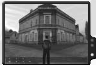
Hier ist die Kneipe.

Sobald alle zusammen sind, begeben euch nach St. Pierre. Wenn alle in der Kneipe sind, ist der Einsatz beendet.