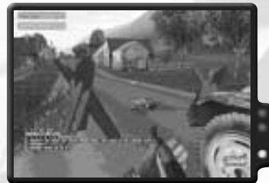
Neutralisiere den Kontrollpunkt in Vernon.

Sobald alle Guerillas an Bord sind, fährst du die Piste zum ersten Kontrollpunkt hinunter. Bleibe ruhig und lass den Anführer der Guerillas die Durchfahrt mit einer Bestechung regeln. Wenn der feindliche Soldat den UAZ, der die Straße blockiert, zur Seite fährt, fahre nach Süden in Richtung Vernon. Wenn du in Vernon ankommst, bemerkst du einen Offizier am Kontrollpunkt.