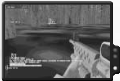
Halte im Wald nach sowjetischen Soldaten Ausschau.

Du bist nun auf dich allein gestellt. Auf der Straße wimmelt es vor feindlichen Truppen und Panzern. Du wirst einen anderen Weg zum Evakuierungspunkt finden müssen. Begib dich nach Nordwesten zu Db68, dann nach Norden zu Db64. Setze deinen Weg nach Norden zu Dd63, dann nach Dh61 fort. Wende dich nach Osten und begib dich zu Eb62, dann nach Süden zu Ea64. Du solltest auf diesem Weg zwar auf keinen Widerstand stoßen, aber sei dennoch vorsichtig. Wenn du den Evakuierungspunkt erreichst, wurde er bereits von sowjetischen Truppen überrannt. Sie nehmen dich gefangen. Mach dir jedoch keine Sorgen. Widerstandskämpfer werden kommen und dich befreien.