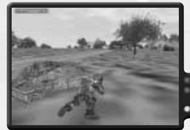
Eine Munitionskiste ist eine gute Schützenposition. Sie bietet nicht nur Munition, sondern auch Deckung.

Ähnlich dem Flaggenkampf, bekommst du hier allerdings nur 5 Punkte, wenn du die Flagge ablieferst. Doch das Einsatzgebiet ist kleiner und die zurückzulegende Distanz somit kürzer.