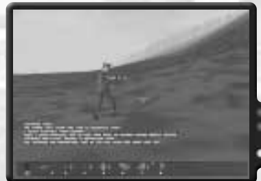
Gehe zu General Guba, um ihn gefangen zu nehmen. Er ist unbewaffnet.

Verschwende mit dem Zerstören des Panzers nur keine Zeit. Benutze Raketen deiner Wahl. Du solltest nur etwas Kanonenummunition für später aufsparen. Wenn der Panzer qualmt, hole den M113 herbei, damit er sich um die aussteigende Besatzung kümmert.