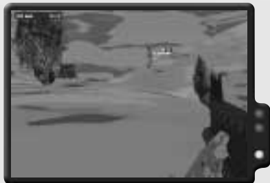
Ein weiterer Speznaz beseitigt.

Du musst einfach nur die Einrichtung im südlichen Sektor bewachen. Ungefähr eine Minute, nachdem der Einsatz begonnen hat, kommt dein Anführer mit einem Jeep herangefahren, um nach dir zu sehen. Nachdem er wieder fort ist, solltest du dich auf ein wenig Action vorbereiten. Gehe entlang des Weges, den der Jeep hinunter gefahren ist, nach Südosten und finde eine Position zwischen dem Weg und dem Hügel im Süden. Lege dich auf den Boden, blicke aus deiner Deckung heraus nach Südosten, und lade eine Leuchtrakete. Schieße gelegentlich eine in die Luft, um dabei zu helfen, das Gebiet zu beleuchten. Zwei Speznaz-Soldaten werden versuchen, deine Position zu infiltrieren und Sprengsätze zu legen. Beide werden, einer nach dem anderen, genau in dein Sichtfeld kommen. Erschieße sie, bevor sie irgendwelchen Ärger machen können.