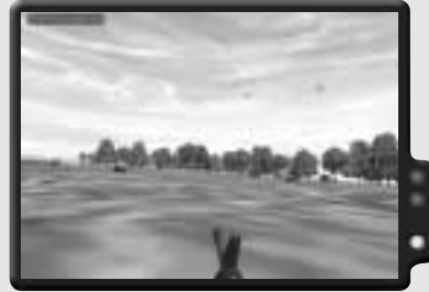
Laufe so schnell du kannst zum Rückzugspunkt.

Schließlich geht der Feind mit Panzern an Land und du wirst angewiesen, dich zurückzuziehen. Verlasse deinen Geschützgraben und begib dich zum Rückzugspunkt. Falls du verletzt wurdest, während du das Geschütz besetzt hattest, statte dem nahe gelegenen Erste-Hilfe-Zelt einen Besuch ab, um deine Wunden zu heilen.