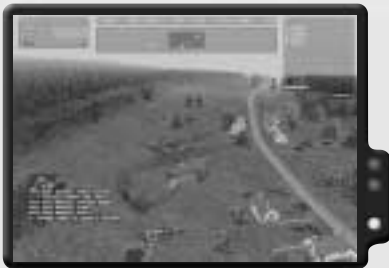
Beseitige diesen Shilka so bald wie möglich mit einem TOW.

Du beginnst den Einsatz in einem Jeep mit deinem Schützen. Tritt aufs Gas und fahre zum Hubschrauberlandeplatz. Folge dem Treibstofflaster die Straße entlang. Er wird dich dorthin führen, wo du hin musst. Dort angekommen, steige aus und mache Meldung. Diesmal sollst du einen Cobra Jagdhubschrauber fliegen. Steige ein und bringe ihn in die Luft. Folge deinem Anführer nach Süden dem Feind entgegen. Als Erstes begegnest du einem Konvoi. Neutralisiere den BMP und jage dann die Lastwagen mitsamt der begleitenden Fußtruppen in die Luft. Generell gilt für diesen Einsatz: Benutze FFARs für BMPs, Geschütze für Lastwagen und Soldaten, und TOWs für Panzer. Neige den Helikopter vorsichtig nach vorne, um mit deinen Raketen auf ein Ziel zu feuern. Während du dies tust, verringert sich dein Auftrieb und du verlierst an Höhe. Kompensiere durch Drücken von [Q] , um mit dem Steuerknüppel die Höhe zu halten. Während des Einsatzes solltest du versuchen, zwischen 100 und 150 Fuß über dem Boden zu bleiben. Auf diese Weise vermeidest du bei einem Angriff, in einen Wald oder Hügel zu fliegen.