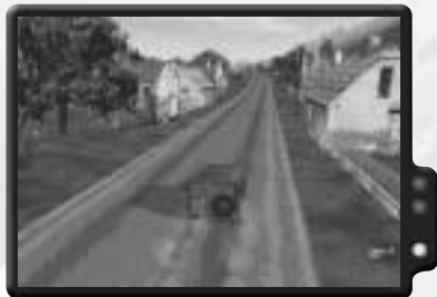
Auf der Suche nach einem Ort für einen Hinterhalt.

Wähle als Nächstes einen Ort für deinen Einsatz. Operation Flashpoint bietet drei riesige Karten und eine Wüstenkarte an, alle mit weitläufigen Gebieten, die zahlreiche Stellen enthalten, an denen du deinen Einsatz stattfinden lassen kannst. Eine der besten Methoden, einen Ort auszukundschaften, besteht darin, ein generelles Gebiet oder eine Insel zu finden, einen Jeep oder Hubschrauber dort zu platzieren und die Vorschau des Einsatzes anzusehen. (Wie man das macht, wird später erklärt.) Betritt die Karte und fahre oder fliege umher, um die perfekte Stelle zu finden. Ein Hubschrauber eignet sich am besten, weil er schneller ist und ein größeres Gebiet auf einmal überblicken kann.