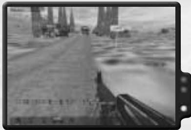
Halte den Konvoi zurück, bis die Route frei ist.

Der Kanonier im M113 kann mit ihnen alleine fertig werden. Fahre einfach in Position, so dass er auf den Feind schießen kann. Befiehl dem Konvoi, auf der Kreuzung rechts abzubiegen. Du allerdings nimmst die südliche Route. Es kann sein, dass du direkt westlich von Arudy einigen weiteren Gegnern begegnest. Wieder wird der M113 leicht damit fertig. Du solltest jedoch in einiger Entfernung von Dourdan anhalten. Steige ab und führe deinen Trupp vorsichtig voran. Du stößt hier häufig auf eine Patrouille und sogar auf einen T72. Zerstöre den Panzer schnell, bevor er deinen M113 treffen kann und deinen Trupp verletzt. Stürze dich dann auf die Infanterie. Falls nötig, findest du im Dorf sowohl Munition als auch ein Feldlazarett. Falls dein M113 zerstört wurde, kannst du außerdem einen Lastwagen im Dorf finden. Halte während der Schlacht auf jeden Fall den Konvoi an, damit er nicht in Schwierigkeiten gerät.