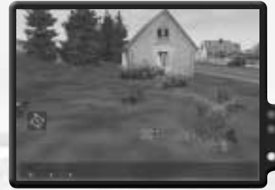
Westen kontrolliert die Flagge im Dorf.

Beide Gruppen kriechen dann zu den gefangenen Soldaten, die sich auf der Ostseite des Dorfs befinden. Passt auf den am Boden liegenden Gegner nahe der Gefangenen auf. Wenn sich das westliche Team an ihn anschleichen und ihn durch den Zaun erschießen kann, könnt ihr verhindern, dass die Gefangenen verletzt werden. Handgranaten sollten auf der Ostseite des Dorfs auf jeden Fall mit Vorsicht benutzt werden.