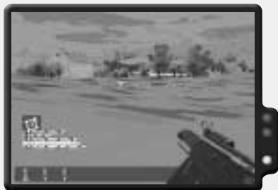
In diesem Einsatz muss viel im Dunkeln herumgekrochen werden.

Dies ist ein Black Ops-Spaßeinsatz für bis zu vier zusammenarbeitende Spieler. Ihr befindet euch hinter feindlichen Linien und müsst eine Menge Zeug in die Luft jagen. Euer Hauptziel ist das Treibstoffdepot in Dourdan. Ihr müsst allerdings auch einen Konvoi zerstören, der nach Houdan im Süden unterwegs ist.