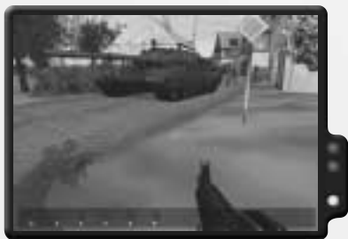
Obwohl er vielversprechend aussieht, ist dieser T72 eine Enttäuschung.

Dies ist ein weiterer kooperativer Einsatz für bis zu sechs Spieler. Ihr beginnt im Dorf Cancon, das gegen einen sowjetischen Angriff verteidigt werden muss. Dann muss sich dein Trupp zum Hafen in La Riviere begeben, um zu entkommen. Was diesen Einsatz noch schwieriger macht, ist, dass dein Trupp noch die Hälfte der Munition besitzt.