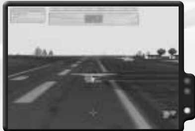
Landung auf Everon.

Dieser Einsatz ist eine Belohnung für die erfolgreiche Rettung der Welt. Er findet einige Jahre später statt, als die vier Charaktere, die du während der Kampagne gespielt hast, sich in Everon wiedertreffen. Es gibt eine Vielzahl von Möglichkeiten, die Einsatzziele zu erfüllen. Eigentlich macht es sogar richtig Spaß, diesen Einsatz mehrmals zu spielen, um verschiedene Möglichkeiten auszuprobieren.