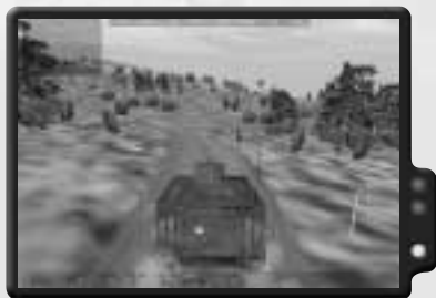
Fahre mit dem M113 voraus.

Nimm für diesen Einsatz ein M21 Scharfschützengewehr, einen LAW-Werfer und drei Raketen mit. Klettere zu Beginn als Fahrer an Bord des M113. Befiehl dem Arzt, den HMMWV zu fahren, und dem Rest des Trupps, in den M113 zu steigen. Fahre mit dem M113 zur ersten Kreuzung. Lass den Arzt in einiger Entfernung folgen. Sobald die erste Hälfte der Strecke zur Kreuzung sicher ist, drücke [0], [0], [2], um den Konvoi ins Rollen zu bringen.